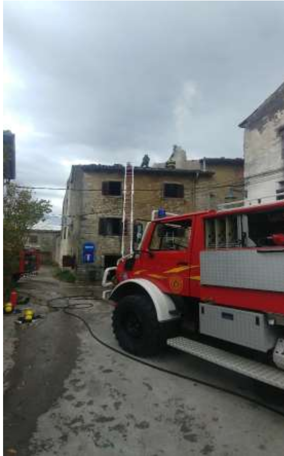
Požar kuće 01.12.2019. godine – Stari grad Buzet

Od požara na građevinama možemo spomenuti požar gašenja stambeno poslovnog objekta u Starom gradu Buzetu koji je nastao 01.12.2019. u jutarnjim satima.