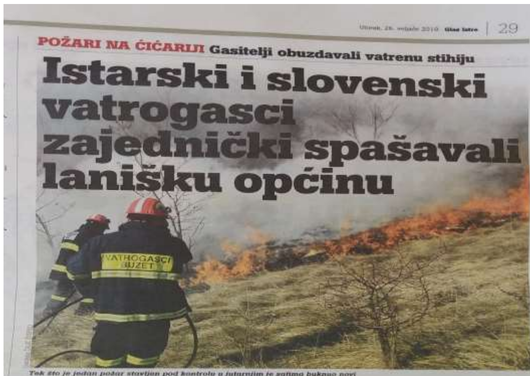
Požar na Čičariji, osvrt Glas Istre 26.02.2019. g.

Od požara na otvorenom prostoru možemo izdvojiti veliki šumski požara u pograničnom području Hrvatske i Slovenije na području Općine Lanišće, iznad mjesta Vodice odnosno na predjelu Žabnika.