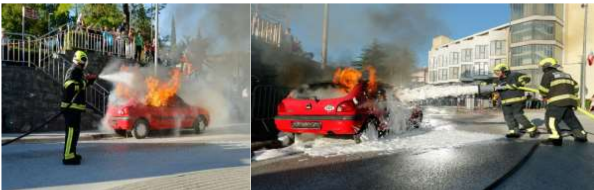
Buzetski dani, pokazna vatrogasna vježba i prezentacija službe, Fontana 2019 g.

U Sklopu Buzetskih dana na Trgu Fontana održana je cjelodnevna prezentacija vatrogasne službe i vatrogasnih intervencijskih vozila te je održana taktičko - pokazna vježba gašenja požara na prometnim sredstvima.