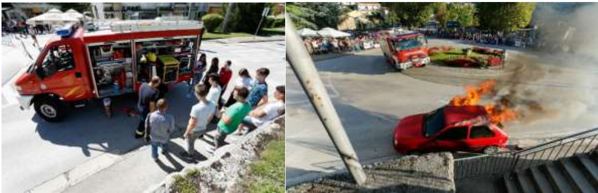
Buzetski dani, pokazna vatrogasna vježba i prezentacija službe, Fontana 2019 g.

Cilj njihovih posjeta je upoznavanje sa vatrogasnom djelatnošću te upoznavanje djece sa požarnim opasnostima u školi, vrtiću, domaćinstvima te na otvorenom prostoru i upoznavanje sa načinom gašenja požara u navedenim prostorima kako intervencije vatrogasaca tako i reakcije i postupci građana kod početnog gašenja požara vatrogasnim aparatima ili priručnim sredstvima.