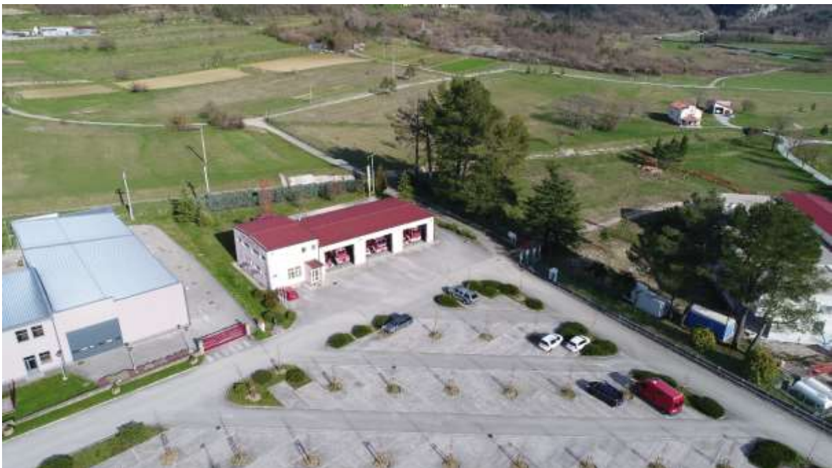
Javna vatrogasna postrojba Buzet slikano dronom

Zahvaljujući Gradu Buzetu i Područnoj vatrogasnoj zajednici Buzet danas imamo dobro opremljenu i operativnu vatrogasnu postrojbu sa kvalitetnim voznim parkom u kojoj je zaposleno 19 djelatnika od čega 17 profesionalnih vatrogasaca raspoređenih u 4 smijene. U svakoj smjeni su 4 vatrogasca a zapovjednik radi u dnevnoj smijeni.